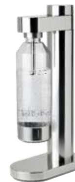
BRUS carbonator - steel