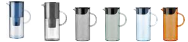
EM77 water filter jug 2 l. blue