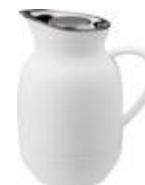
Amphora vacuum jug 1 l. soft white