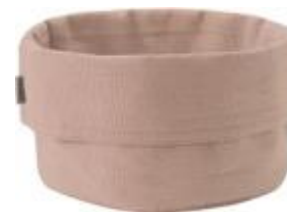
Stelton bread bag, Heather