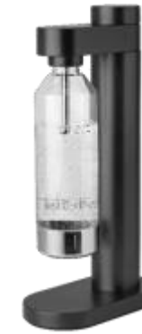
BRUS carbonator - black metallic