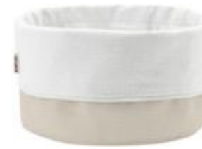
Stelton bread bag, sand / white