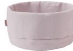
Stelton bread bag, lavender