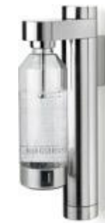
Brus carbonator, wall mount, steel