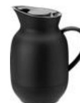
Amphora vacuum jug 1 l. soft black