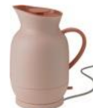
Amphora electric kettle (EU) 1.2 l. soft peach