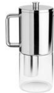
Brus water filter jug 1,8 L