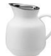
Amphora vacuum jug 1 l. soft white