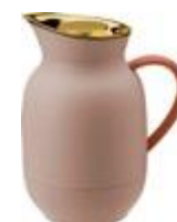
Amphora vacuum jug 1 l. soft peach