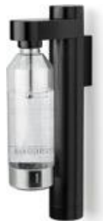
Brus carbonator, wall mount, black