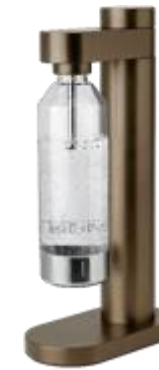
BRUS carbonator - dark brown metallic