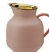
Amphora vacuum jug 1 l. soft peach