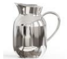
Amphora vacuum jug 1,2 L, steel