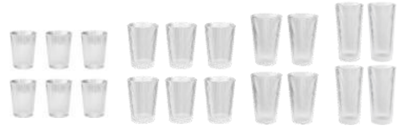
Drinking glass 0,13 L