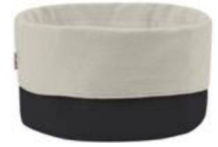
Stelton bread bag, black / sand