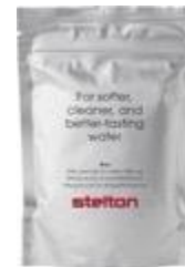
Brus filter granules for water filter jug, 3 pcs