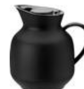
Amphora vacuum jug 1 l. soft black