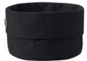
Stelton bread bag, black