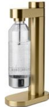
BRUS carbonator - brushed brass