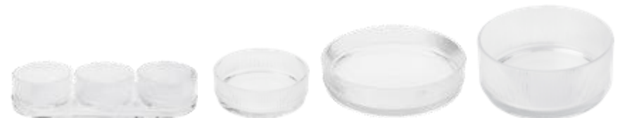
Serving bowl - Ø 15 cm