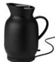
Amphora electric kettle (EU) 1.2 l. soft black